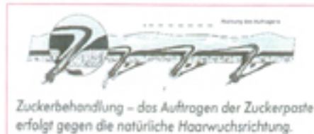
Zuckerbehandlung – das Auftragen der Zuckerpaste erfolgt gegen die natürliche Haarwuchsrichtung.