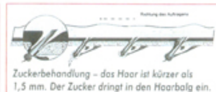
Zuckerbehandlung – das Haar ist kürzer als 1,5 mm. Der Zucker dringt in den Haarbalg ein.